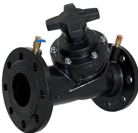
Рис. 1 Общий вид клапана типа MNF, модификация MNF-R

Клапаны балансировочные типа MNF, модификация MNF-R (далее – клапан MNF-R) используются для монтажной наладки трубопроводных систем тепло - и холодоснабжения зданий и сооружений с целью обеспечения в них расчетного потокораспределения.